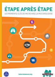
Brochure Étape après étape : Les moments-clés de ma vie avec la mucoviscidose