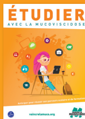
Brochure Étudier avec la mucoviscidose