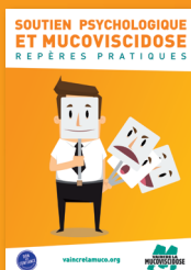
Brochure Soutien psychologique et mucoviscidose