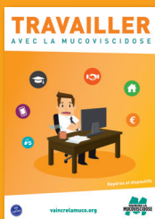
Brochure Travailler avec la mucoviscidose