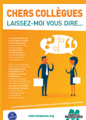
Brochure Chers collègues