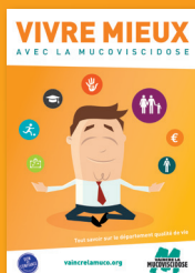
Brochure Vivre mieux avec la mucoviscidose