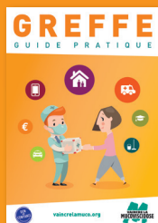
Guide pratique Greffe