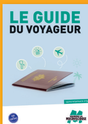
Le Guide du voyageur