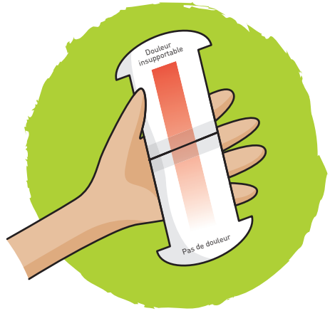
Echelle visuelle analogique (EVA)

Centre national de recherche sur la douleur www.cnrdf.fr fiches de soins, listes des consultations et centres anti-douleur