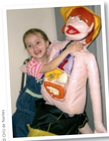
La poupée Lou